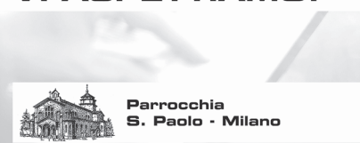
Parrocchia S. Paolo - Milano